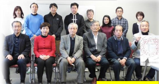
大同窓会のポスター